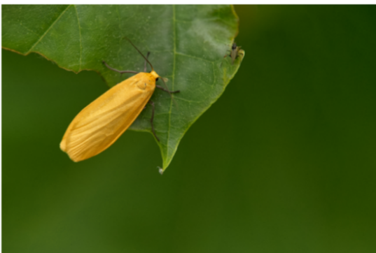
Dottergelbes Flechtenbärchen - Gerd Butke

Ort: Zooschule im Tierpark Nordhorn, Eingang durch die Nebentür am Eingangsgebäude, Hauptparkplatz, Heseper Weg 110