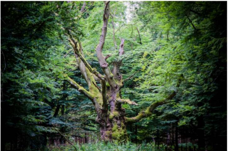
Tinner Loh - Tobias Suntrup