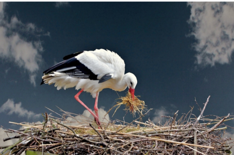
Weißstorch - Wilfried Jürges