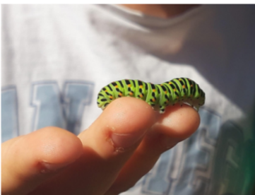
Raupa Schwalbenschwanz - Anne Risse

Wir gehen auf Erkundungstour: Welche Bewohner des Naturgartens können wir entdecken und finden wir auch für uns