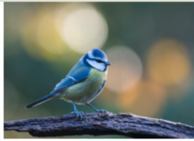
Blaumeise - Dr. Erhard Nerger

Am ersten Januar-Wochenende sind kleine und große Vogelfreund*innen aufgerufen, eine Stunde lang die Vögel am Futterhäuschen, im Garten, auf dem Balkon oder im Park zu zählen und zu melden. Weitere Infos unter: www.stunderwintervoegel.de