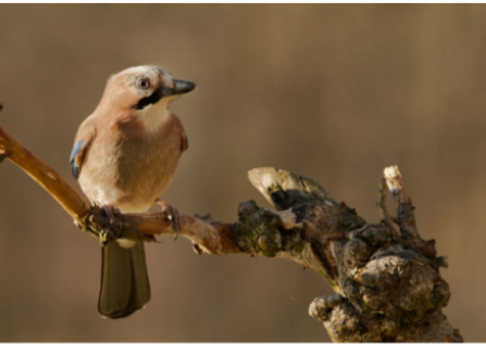
Eichelhäher - Gesine Butke