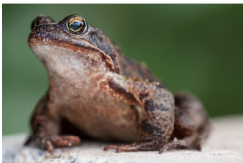
Grasfrosch - Tobias Suntrup

Mithilfe bei der Krötenwanderungsaktion an der Emdener Straße / Bülte. Die Termine sind witterungsabhängig und werden kurzfristig bekannt gegeben unter www.nabu-emsland-nord.de Ansprechpartner: Thomas Großmann 0151-16943092