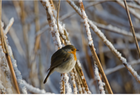
Rotkehlchen - Gerd Busmann