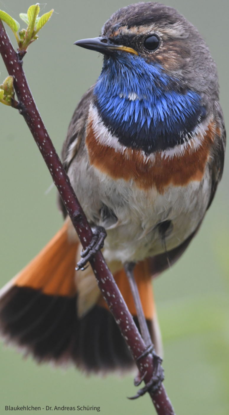
Blaukehlchen